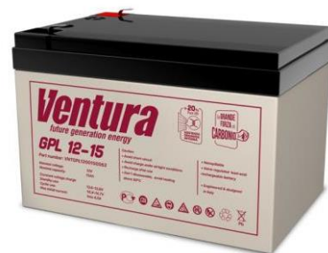
Габаритные размеры, мм